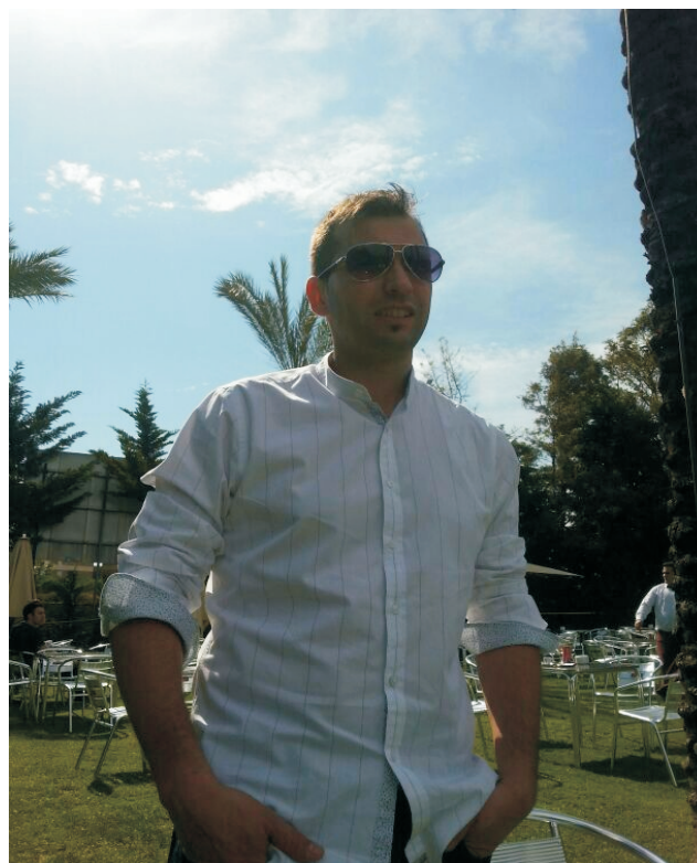
El compañero de calidad fotografiado este verano para Tiempos Modernos.

celebrará su juicio en los juzgados de Granollers el próximo 9 de Octubre. Trabajador de trato afable e impecable hoja de servicios, repasa con Tiempos Modernos el año transcurrido desde el fatídico junio de 2013. Mientras la justicia no diga lo contrario, sigue siendo compañero de calidad