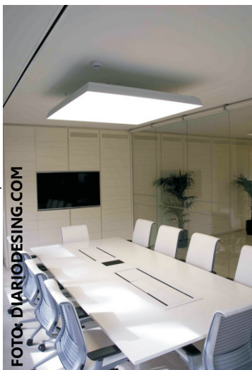
Sala de reunions d'Abertis il.luminada amb Flaying.

b720 Arquitectos i Luxiona han participat en la remodelació integral de la seu corporativa d'Abertis a Madrid. La il.luminació de les oficines d'aquesta empresa cotitzada a l'Ibex-35, s'ha basat en la integració de les zones de servei i de treball i la creació d'una llum difusa i natural que afavoreixi l'ús continuat d'ordinadors; així, l'estudi d'arquitectes ha utilitzat Flaying surface per les sales, i línies