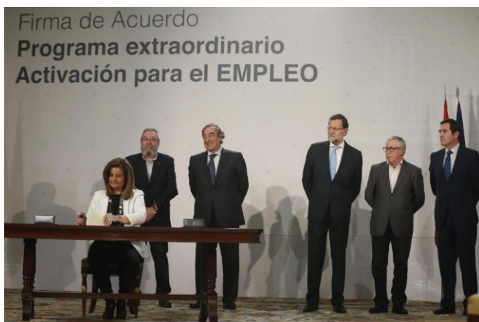
La foto de la vergüenza

Ante el ya famoso acuerdo de los 426 € de ayuda a los parados de larga duración sin ningún tipo de prestación, firmado por CC.OO y UGT con el Gobierno, desde CGT queremos hacer unas aclaraciones. Ese dinero se lo ahorra el empresario ya que no es él quien se lo abona al trabajador, si no el Estado. Él solo tendrá que cumplimentar el resto (unos 200€ hasta llegar al salario mínimo). Un chollo para los empresarios, que se van a poner en la puerta del paro para atar a estos desempleados con una cadena y llevárselos a su empresa (no podrán negarse a aceptar el trabajo). El Gobierno “venderá” miles y miles de empleos, y los mamporreros de siempre Irán corriendo para afiliarlos.