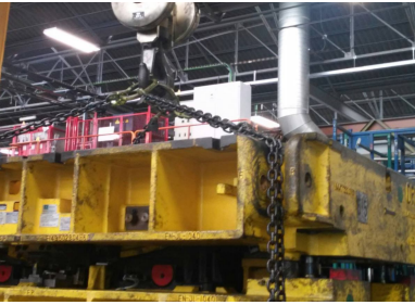
Así se manipulan troqueles en troquelería de Pabellón A