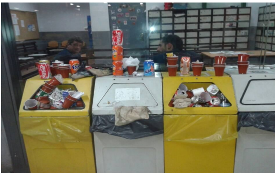
Falta de limpieza a 4º relevo y fin de semana

“Nadie hará por ti lo que tú no quieras . . . hacer por ti mism@”