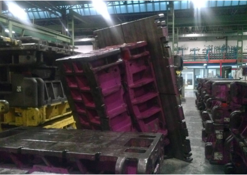
Serios riesgos en el trabajo de montadores