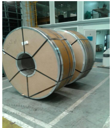
Bobinas mal ubicadas que pueden rodar, “like a rolling stone”