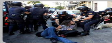
Resistencia a la autoridad