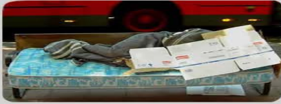
Desahucio de bienes muebles de uso público