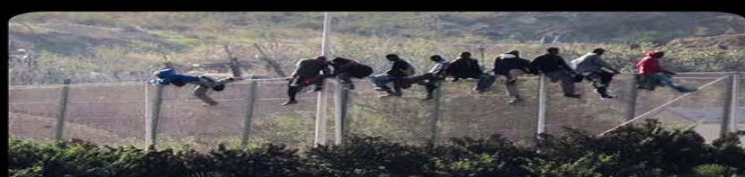
Legalización de "devoluciones en caliente" en la frontera con Marruecos