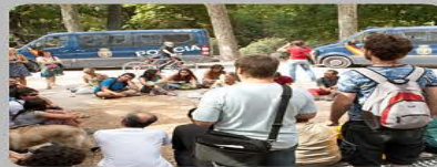
Negativa a disolver una reunión