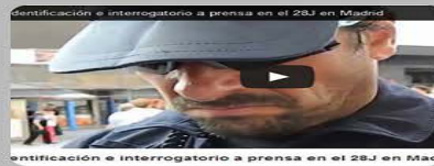
Difusión de imágenes de los agentes de seguridad del estado