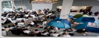
Ocupación o permanencia en cualquier edificio ajeno