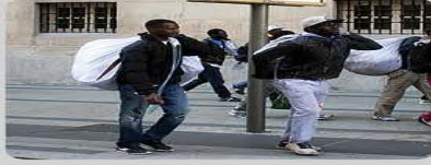
Venta Ambulante (Top Manta)