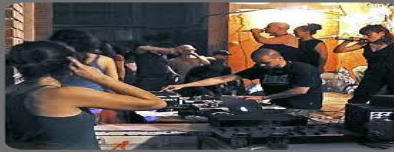
Celebración de espectáculos o actividades recreativas en contra de la prohibición ordenada por la autoridad correspondiente