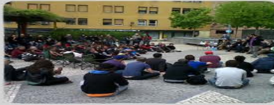
Reuniones en espacio público