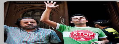
Impedir un desahucio