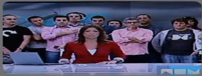
Las protestas en infraestructuras de telecomunicaciones como RTVE