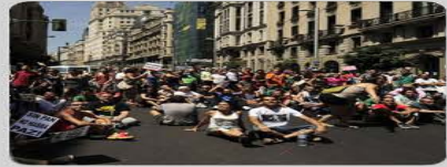
Ocupación de la vía pública