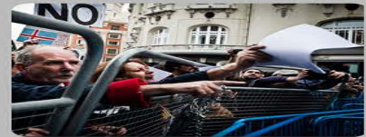
Manifestaciones frente al Congreso, Senado o parlamentos autonómicos