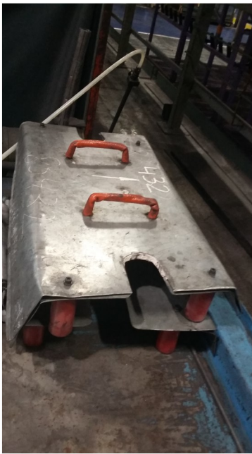
Escudo protector de calor diseño GEBSA Planet.

A pesar de la buena intención en la fabricación de estos elementos para realizar interven-