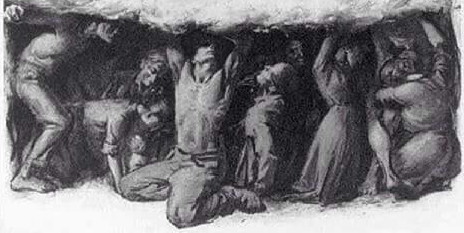
FROM THE DEPTHS